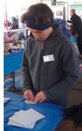
Confection de pochettes à graines (pour le troc !)