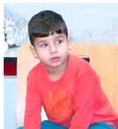
Dior, 4 ans