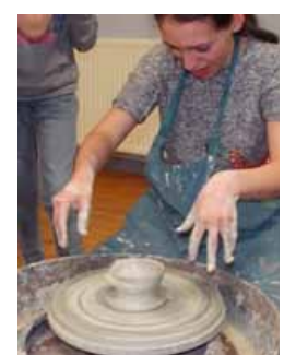
On tente des bols mais on a encore un peu du mal.