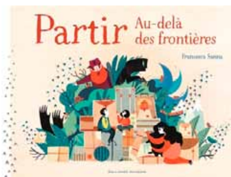
> Partir au-delà des frontières de Francesca Sanna