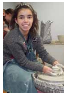
Candice s'y voit déjà !