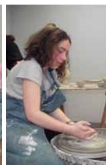
On ne dit pas non aux conseils de Denis