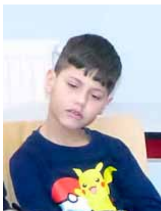
Rédon, 8 ans