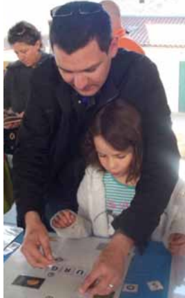
Le mot fléché