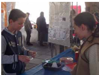
Jean-Baptiste fait sa pochette