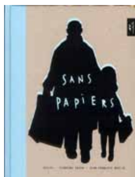
< Sans papiers de Rascal

Béatrice nous a présenté une sélection de livres sur ce thème et elle a lu deux magnifiques albums pour conclure :