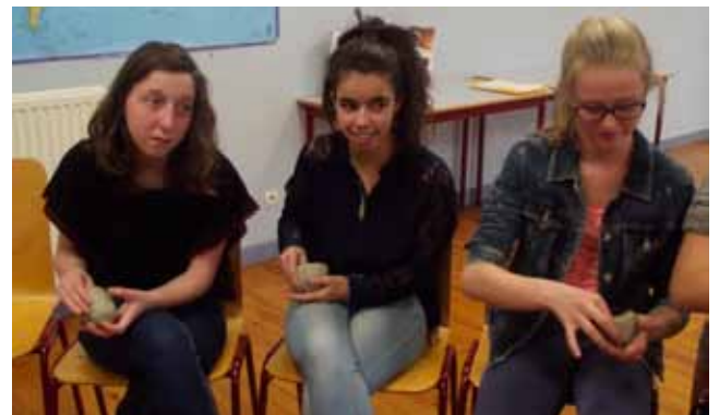
C'est pas facile la poterie !!!